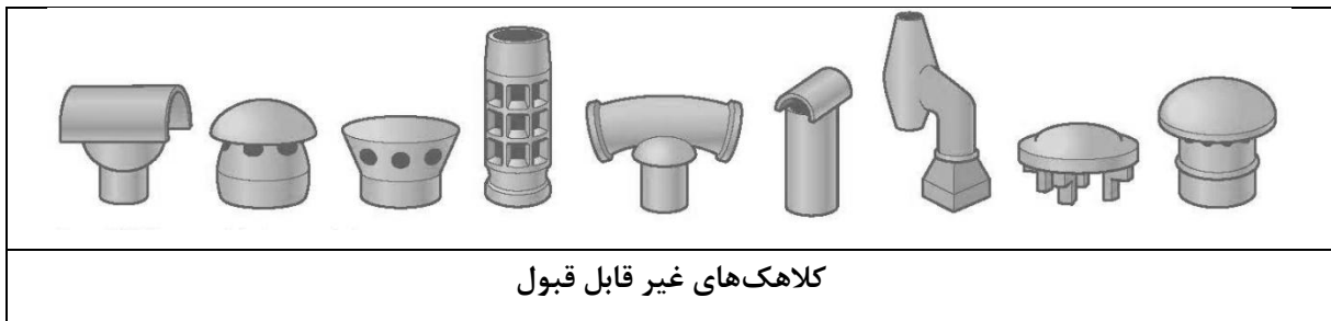
شکل ۲- انواع کلاهک‌های قابل قبول و غیرقابل قبول

استفاده از کلاهک دودکش الزامی است. شکل ۲ کلاهک‌های غیرقابل قبول را نشان می‌دهد. کلاهک دودکش به هر شکلی که ساخته شود مجموع مساحت خالص دهانه خروج دود باید دست کم دو برابر سطح مقطع دودکش باشد. قطر داخلی دهانه اتصال کلاهک به دودکش باید با قطر خارجی دودکش برابر و یا به میزان خیلی جزئی بزرگ‌تر از آن باشد.